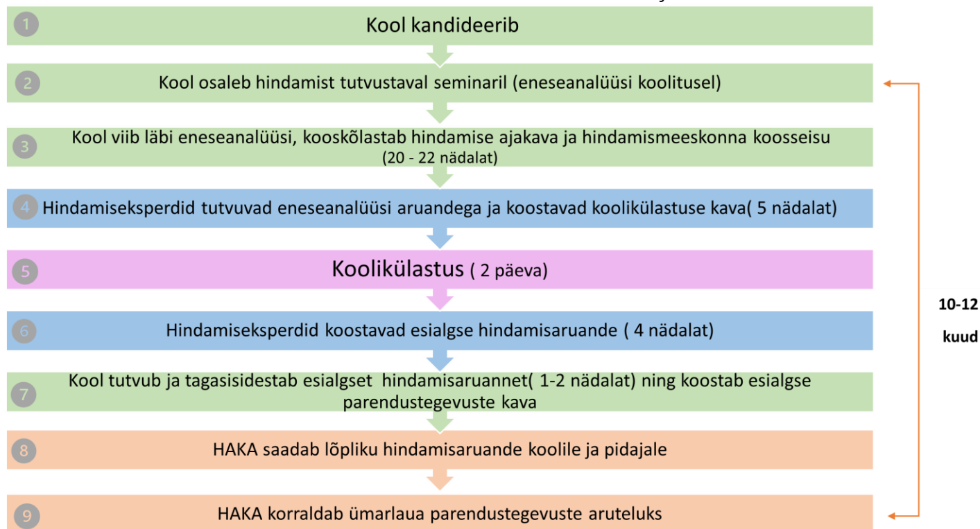
Joonis 2. Ülevaade hindamisprotsessist.