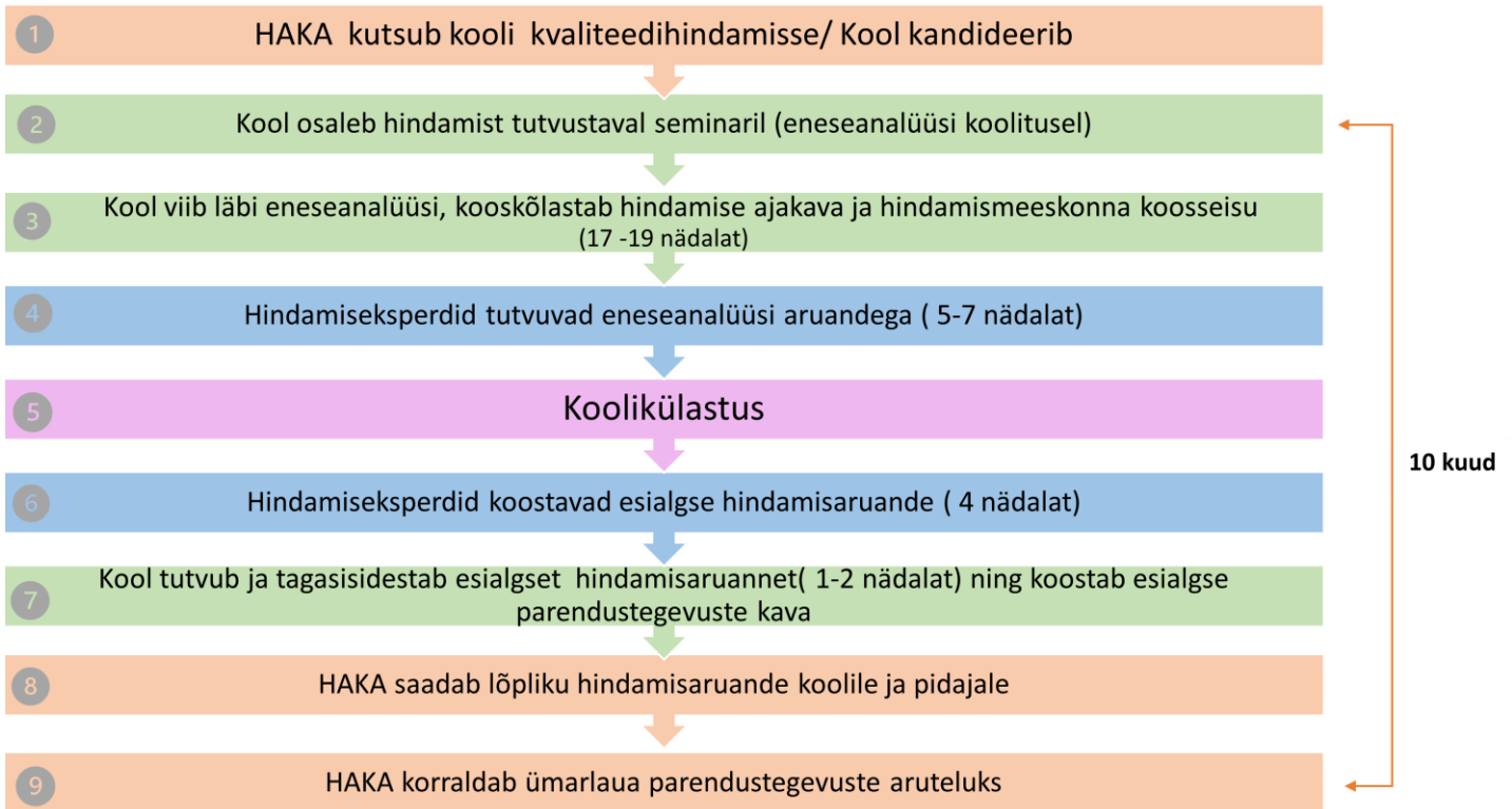
Joonis 2. Ülevaade hindamisprotsessist.