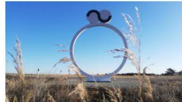
Õ/Õ piiritähis Saaremaal.